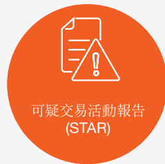
可疑交易活動報告 (STAR)